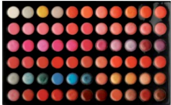
Abb. 5 Palette von 66 kommerziellen Lippenstiftfarben [22].