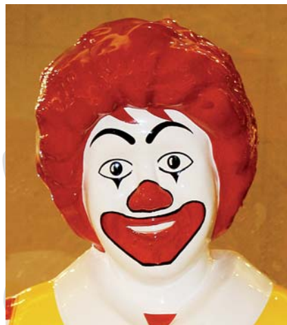
Abb. 3 Der Clown Ronald McDonald. Der komische Ausdruck wird erreicht durch Reduzierung der Augenhorizontalen auf die zwei Augen, durch eine weiße Gesichtsaufdeckung und die rote Überzeichnung der Lippen. Komischer Gesichtsausdruck als ein gewisser Gegensatz zu schön und gerade noch nicht hässlich.

gelegentlich sogar zur Installation, wird „Kunstobjekt“, zuweilen auch mit Marktwert.