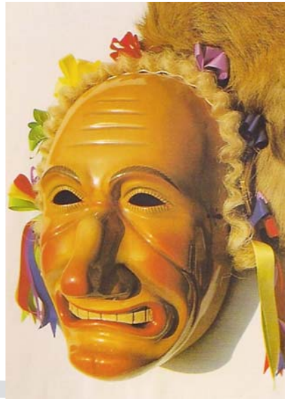
Abb. 2 Alemannische Narrenmaske mit übergroßer Nase und verbreiteter Mundhorizontale, wulstigen Lippen und massivem Zahnsatz, sog. „Rottweiler Biss“ [21].

Der Aufschwung der permanenten Tätowierungen, aber auch von Piercing und Branding gehört dazu. Waren Tattoos jahrhundertlang ein Charakteristikum von Randgruppen oder Ausgestoßenen, der Vogelfreien (Fleur de Lyss), die lebenslang gezeichnet waren und dauerhaft in einer Nische verbannt blieben, so hat sich dies grundsätzlich geändert. Tattoos sind in Mode gekommen, je nach Erhebung tragen 30% und mehr der jungen Leute solche. Es sind dies vielgestaltete „tribal tattoos“, deren Motive den Mustern der rituellen Zeichen im Altertum und der traditionellen archaischen Stämme in Afrika [7] sowie in der Südsee entnommen sind. Manche sind auch als Blickfang, als Schmuck, andere als Bildergeschichten und weitere als Beschwörung zu verstehen. Sie alle dienen nicht dem Ausschluss, sondern bezeichnen oft die Zugehörigkeit zu einer Gruppe oder einer besonderen Person. Sie werden stolz und sichtbar getragen, dienen also dem Ausdruckswillen und der Attraktivität der Träger. Sie sind zusammen mit dekorativer Kosmetik, Haartracht und Kleidung gefügige Instrumente zum Ausdruck von Gesinnung und Absicht des Trägers oder der Trägerin. Dies erlaubt eine besondere und individuelle Gestaltung der Körpersprache. Der Körper wird