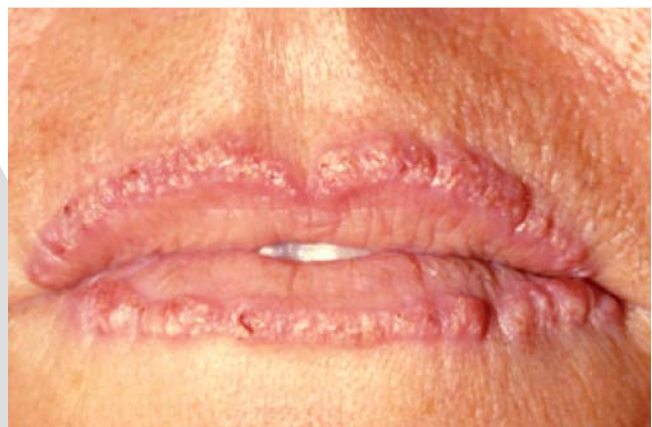
Abb. 6 Markierung des Lippenrandes als permanentes „Make-up“ zur Betonung der Mundpartie. Sekundäre granulomatöse Fremdkörperreaktion als unerwünschter Nebeneffekt [22] (Bild: Univ.-Hautklinik Mannheim, Prof. C. Bayerl und Dr. G. Feller-Heppt).

einem ebenso reichhaltigen Band über die Hässlichkeit [19]. Schönheit und Hässlichkeit sind auf einer affektiven Skala diametral entgegengesetzt, bilden also ein richtiges Gegensatzpaar. Die Hässlichkeit orientiert sich einerseits an der antiken Medusa-Figur [20], als Sinnbild der schrecklichen Hässlichkeit, und andererseits an den traditionellen Masken der Alpenländer