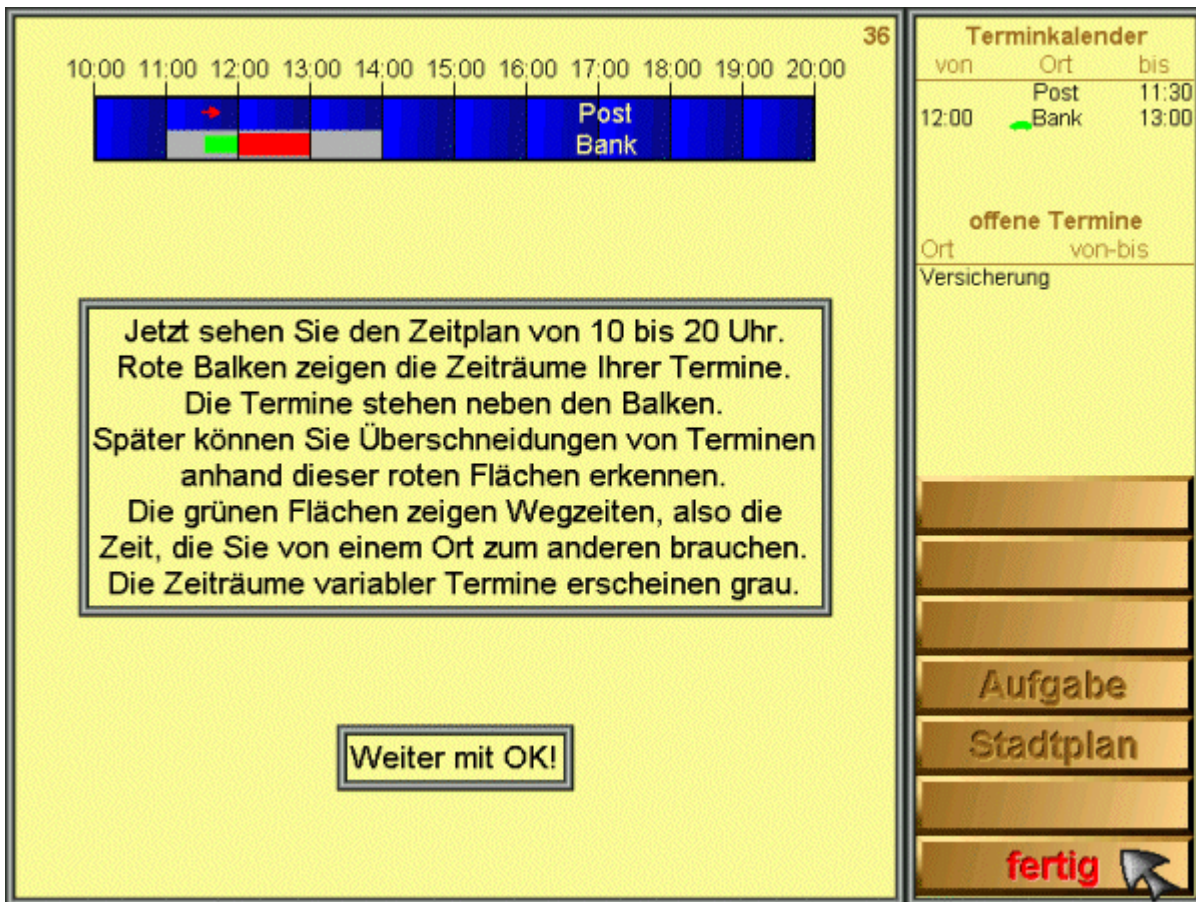
Abbildung 3: Grafische Darstellung der Termine mit Erläuterung in der Instruktionsphase von Level 36 im Zeitplan .

Ab Level 26 kann für die Verkürzung von Wegzeiten ein Taxi benutzt werden. Soll das Taxi verwendet werden, muß "vor Antritt der Fahrt" die Funktionstaste Taxi betätigt werden. Es wird dann als Taxisymbol ein grünes Auto sichtbar (Abbildung 4), das auch beim relevanten Termin im Kalender und der Zeitgrafik erscheint. Weiter sei darauf hingewiesen, daß bei Aufgaben zur Wegzeitminimierung die Wegzeiten in Minuten vom aktuellen Standort aus im Stadtplan erscheinen (Abbildung 4). Sie ändern sich mit dem Standort. Die Benutzung des Taxis halbiert eine Wegzeit. Nähere Erläuterungen liefert die Patienteninstruktion vor einer solchen Aufgabe.