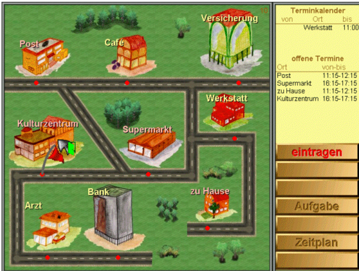
Abbildung 2: Phase Stadtplan im Schwierigkeitsgrad 10. Die zu besuchenden Gebäude sind im Unterschied zu den anderen in hellroter Schrift gekennzeichnet.

In der Phase Stadtplan wird diese Strategie dem Computer übermittelt. Es erscheint ein kleiner Stadtplan mit neun Gebäuden, die über Straßen verbunden sind (Abbildung 2). Um die Lösung der Aufgabe in den Computer einzugeben, können die Tasten des RehaCom-Pultes, die Maus oder ein Touchscreen verwendet werden. Im folgenden wird die Bedienung mit der Maus erläutert, deren Position durch einen grauen Pfeil angezeigt wird.