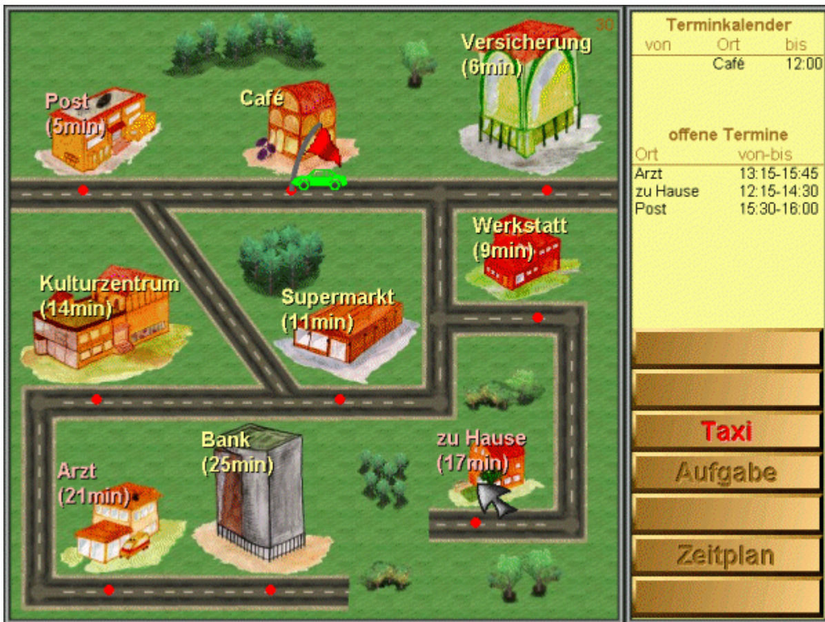
Abbildung 4: Taxisymbol und Wegzeiten im Schwierigkeitsgrad 30.

Hat der Patient die Planungsaufgabe beendet, ist die Funktionstaste fertig zu betätigen. Bei einer fehlerhaften Lösung erscheint eine differenzierte Fehlermeldung. Es wird gefragt, ob eine Korrektur gewünscht wird. Bei Bestätigung (Taste Ja ) erscheint erneut die letzte Aufgabe, die mittels Funktionstaste zurück korrigiert und neu entschieden werden kann. Ansonsten wird die Aufgabe bewertet und zum nächsten Schwierigkeitsgrad informiert.