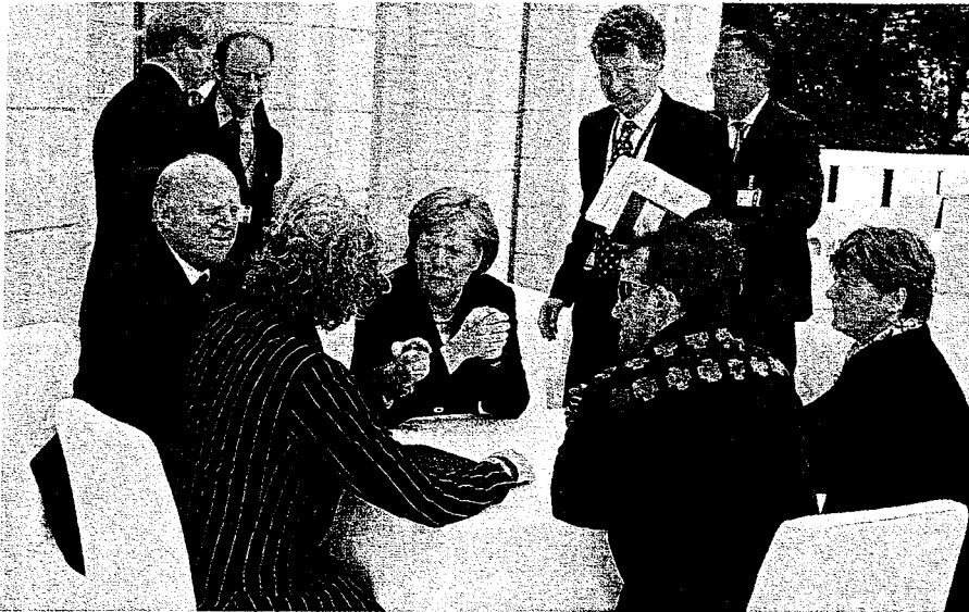
Komplexes Problemlösen gefordert: Angela Merkel muss auf dem G8-Gipfel in Heiligendamm viele verschiedene Interessen beachten, wie hier im Gespräch mit den Nichtpolitikern Bob Geldof und Bono

PH In den jüngsten PISA-Studien spielt das komplexe Problemlösen als schulfachunabhängige Schlüsselqualifikation eine übergeordnete Rolle. Sind deutsche Schulen stimmungs- und denktötende Umwelten?